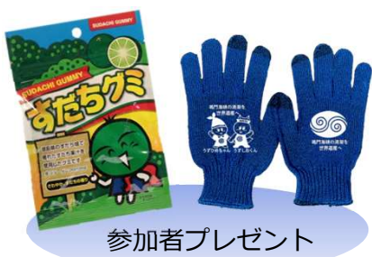
参加者プレゼント